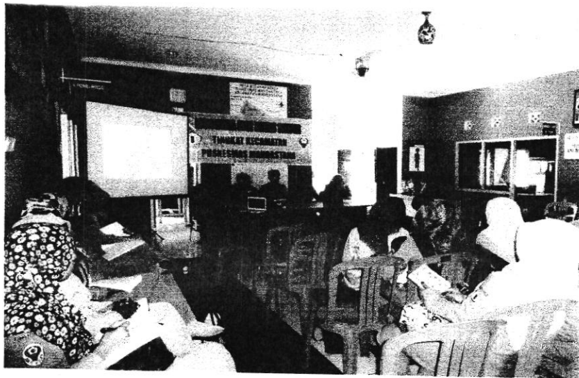
Lokmin Lintas Sektor Puskesmas