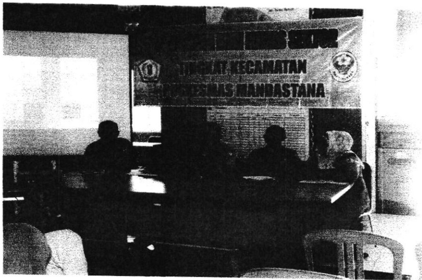
Lokmin Lintas Sektor Puskesmas