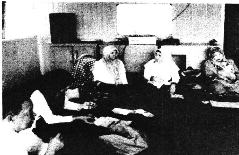
P4K (Program Perencanaan Persalinan dan Pencegahan Komplikasi) di Desa