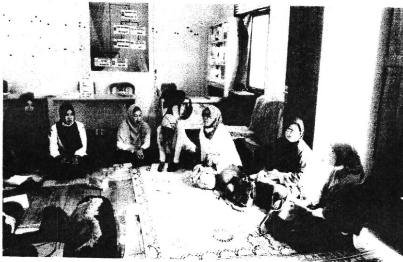
P4K (Program Perencanaan Persalinan dan Pencegahan Komplikasi) di Desa